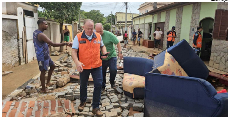
Em Mimoso do Sul, Casagrande acompanhou o início do trabalho de limpeza de ruas e atendimento às pessoas afetadas pela consequência das chuvas