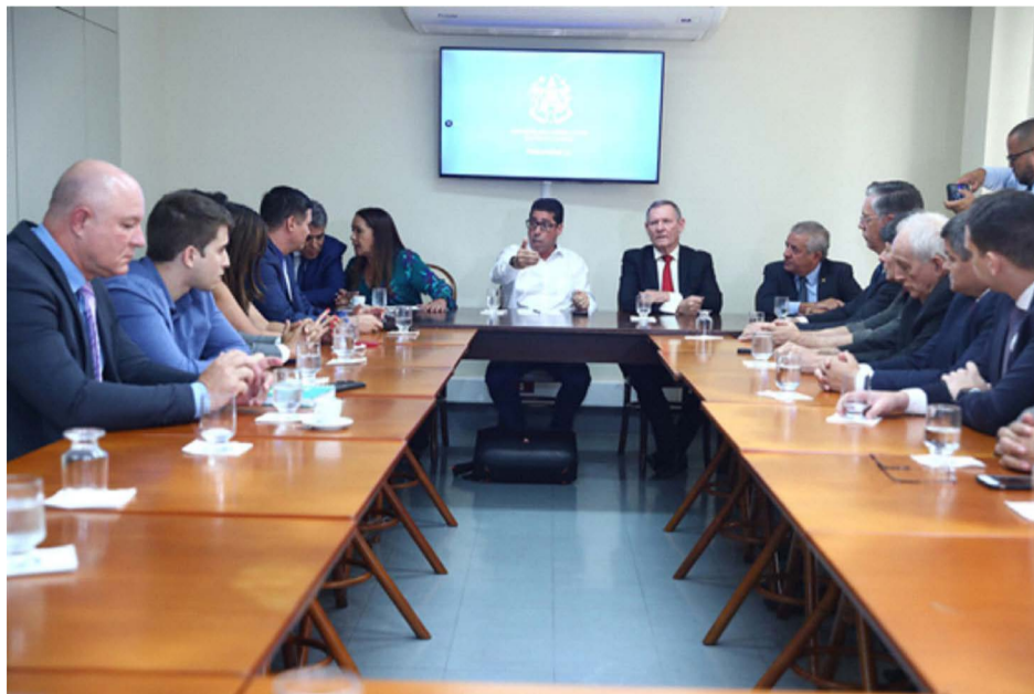
Deputados em reunião para tratar de ações de ajuda humanitária aos municípios que foram atingidos pela forte chuva no Sul

O presidente da Assembleia Legislativa (Ales), deputado Marcelo Santos (Podemos) se reuniu na tarde dessa segunda-feira (25) com os demais parlamentares para tratar de ações de ajuda humanitária aos municípios que foram atingidos pela forte chuva que acometeu, sobretudo, a Região Sul capixaba, no último final de semana. O Legislativo encaminhará ao governo do Estado um documento assinado por todos os deputados com um conjunto de ações propostas para auxiliar as vítimas da tragédia.